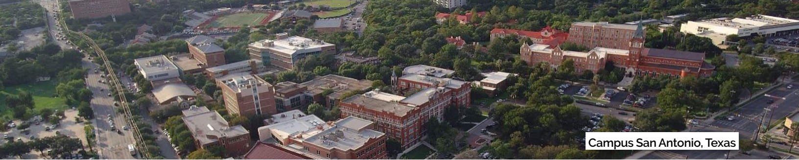
Campus San Antonio, Texas