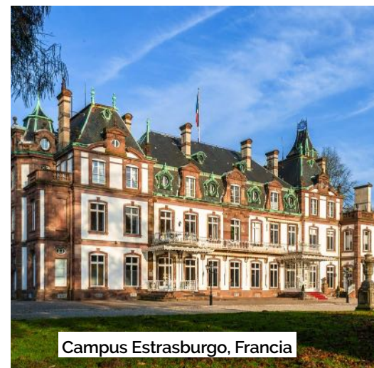
Campus Estrasburgo, Francia