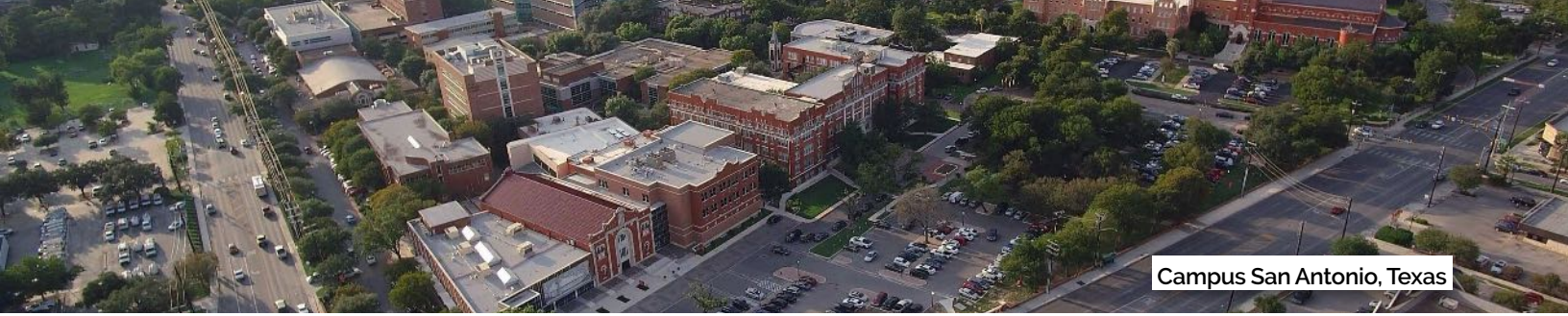
Campus San Antonio, Texas