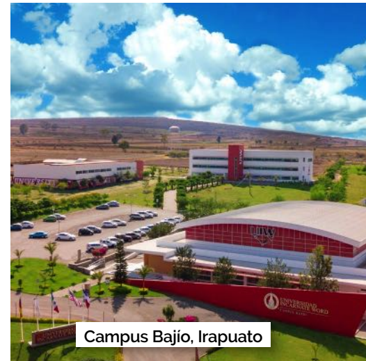
Campus Bajío, Irapuato